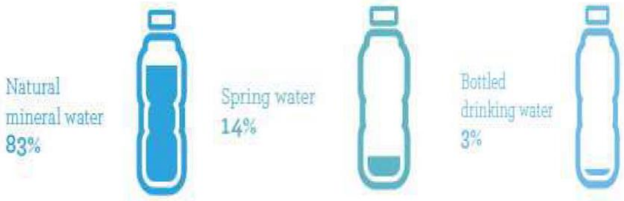
Kuva 1.

Euroopassa hyvin suuri osa pakatusta juotavasta vedestä on luonnon kivennäisvettä. Suomessa suurin osa pakatusta vedestä on hanavettä.