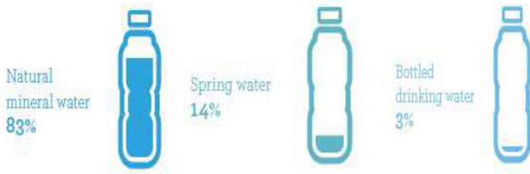
Kuva 1.

Euroopassa hyvin suuri osa pakatusta juotavasta vedestä on luonnon kivennäisvettä. Suomessa suurin osa pakatusta vedestä on hanavettä