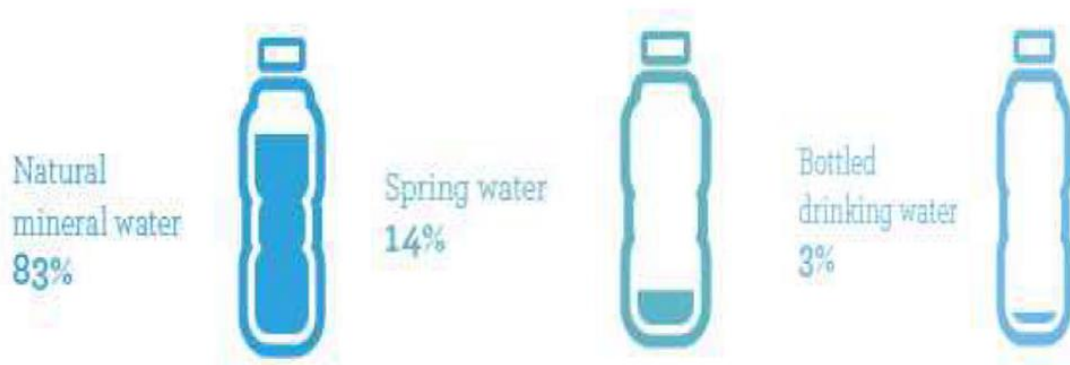
Bild 1. Källa NMWE www.naturalmineralwaterseurope.org

I Europa är en mycket stor andel av packat dricksvatten naturligt mineralvatten. I Finland är största delen av packat vatten kranvatten.